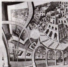
M.C. Escher, Prentententoonstelling (1956) The M.C. Escher Company