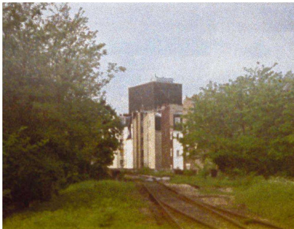
Linksboven Alps , 2001. Het overige beeld uit de serie La Petite Ceinture , Parijs, uit 2003.