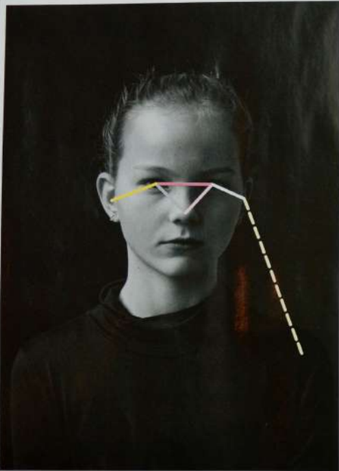
Beelden uit de serie 'Through a Glass, Darkly. Invisibility as a Human Right?', van Martine Stig.