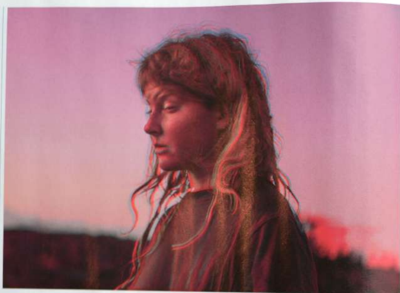
Uit de serie 'Pink Desert', van Roderik Henderson. Hij gebruikte zijn dochter als model.