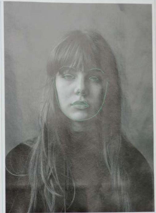
Met overal camera's is het schier onmogelijk om nog onzichtbaar te zijn.

Voor de generatie die opgroeide met Harry Potter en sociale media heeft onzichtbaarheid twee tegen- gestelde betekenissen, ontdekte Stig. Er is onzichtbaarheid als superkracht, gesymboliseerd door Potters onzichtbaarheidsmantel, legt ze uit. En er is onzichtbaarheid als machteloosheid: geen volgers op sociale media. In welke vorm dan ook, 'onzichtbaarheid helpt ons na te denken over de structuur van onze samenleving, over hoe