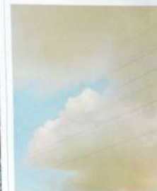
De serie 'Oasis', van Matthieu Litt, gaat over de wisselwerking tussen natuur en emoties.

Het landschap rond de Belgische stad Luik lokt uit tot bespiegeling.